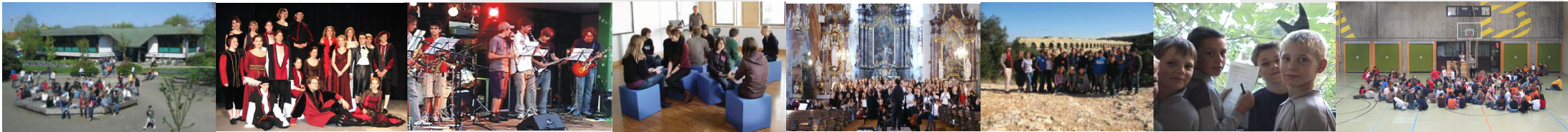
Spaß am Sport