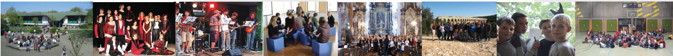
Spaß am Sport